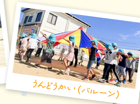
うんどうかい(バルーン)