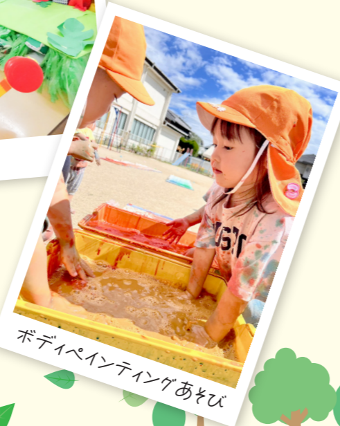
ボディペインティングあそび