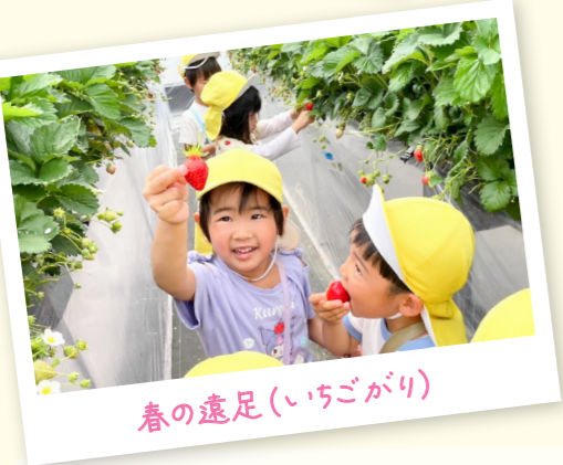
春の遠足(いちごがり)