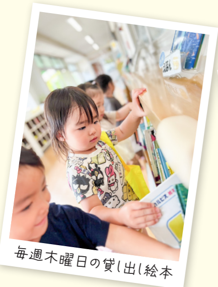
毎週木曜日の貸し出し絵本