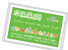
ポケットティッシュ