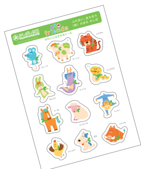
はがしやすいシール