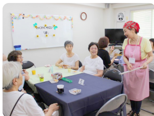
サロンでの楽しいひととき