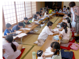
夏休み子ども教室