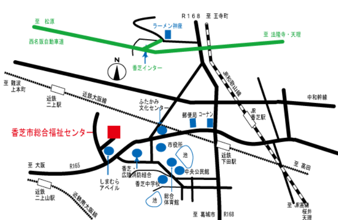
香芝市総合福祉センターの付近